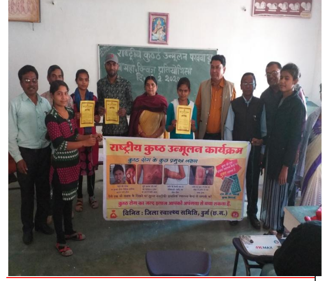
http://govtcccollegepatan.in/events_details.aspx?eid=216 Fighting against worm through YRC