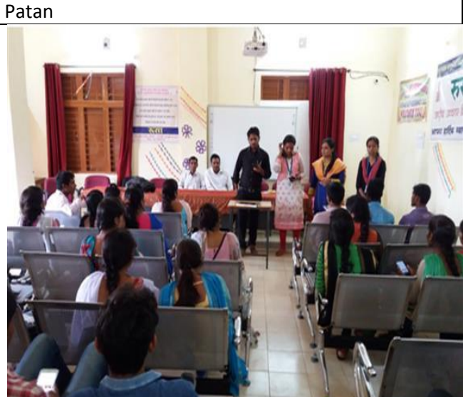
http://govtcccollegepatan.in/events details.aspx?ei d=13

Code of conduct is being presented by the Antiragging committee in the college